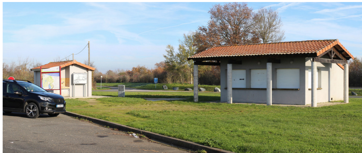
Photographie de l'état initial à 50°